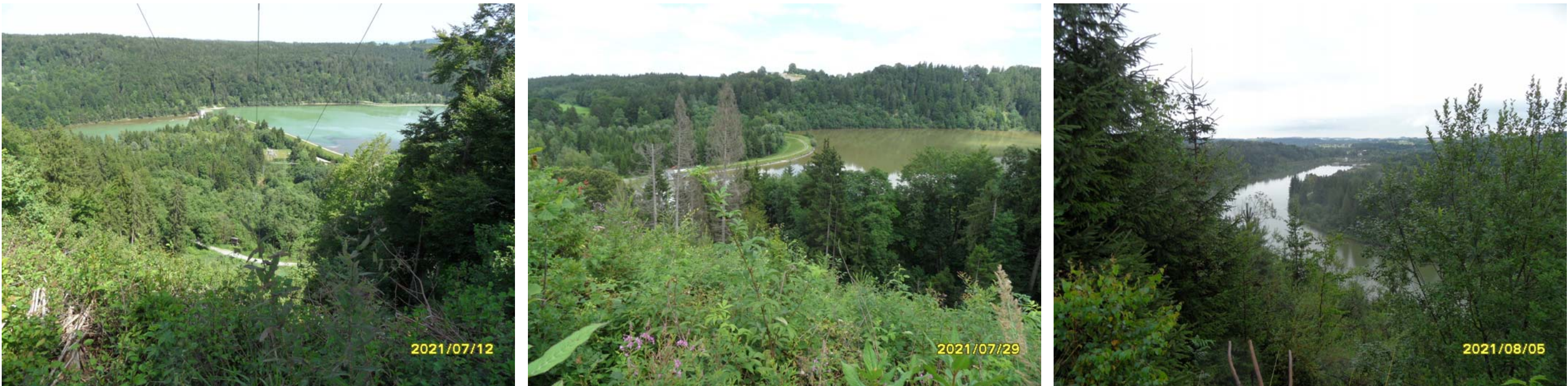
Abbildung 2: Darstellungen des Lechtals und damit der Gegebenheiten vor Ort